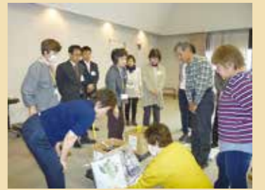
生ごみたい肥化講座 (長野市の受託事業)