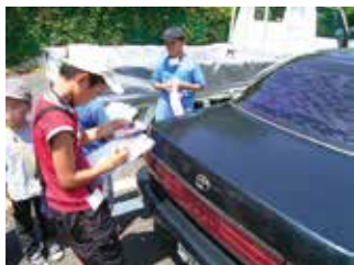
エコアクティブ塾「街の温暖を探ろう」 車の表面温度は72℃もありました。