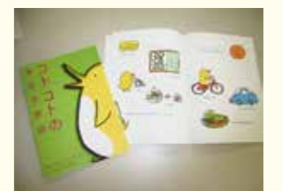
「コトコトの省エネ学級」 省エネ啓発冊子を作成