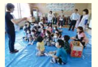
保育園での生ごみたい肥化講座 (長野市の受託事業)