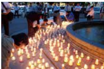
キャンドルナイトコンサート 電気を消してスローな夜を