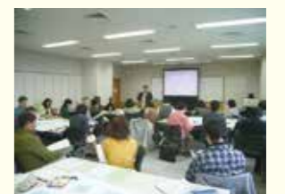
環境NGOのための組織運営講座 ワークショップ