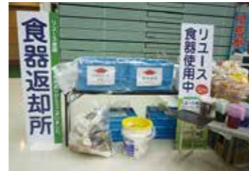
リユース食器の貸し出し (信州環境フェアにて)