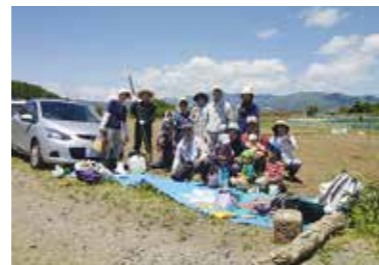
ひまわり畑の種まき

遊休農地を使い、食用油になるヒマワリと大豆、スイカやさつま芋を栽培。採れた大豆で味噌づくり