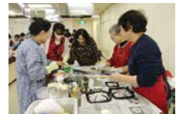
エコサロン 自然素材を使って家中ピカピカ!