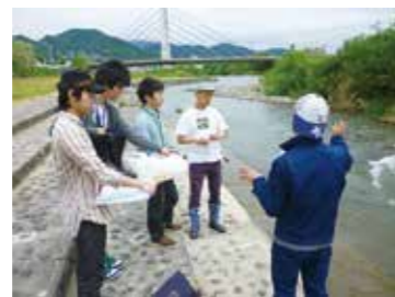
「身近な水環境全国一斉調査」に参加